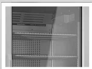
Beste Übersicht durch Glastür Gewährt das Beobachten der Messeinrichtungen.